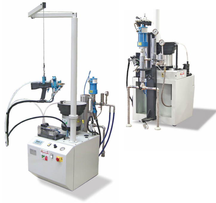
SPINAMATIC mod. GLF/HP Serramento - Frame