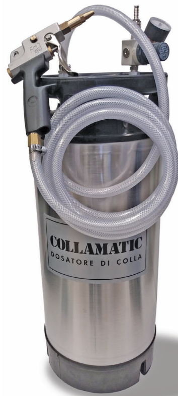
COLLAMATIC 18 Kg