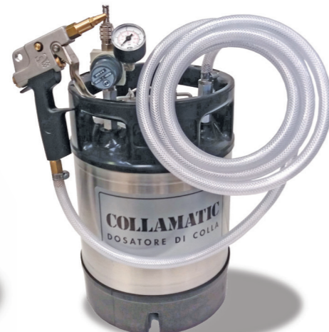
COLLAMATIC 9 Kg