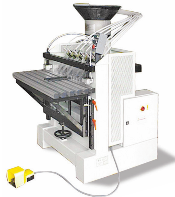
SPINAMATIC mod. P696 Inseritrice per colla e spine Inserting machine for glue and dowels