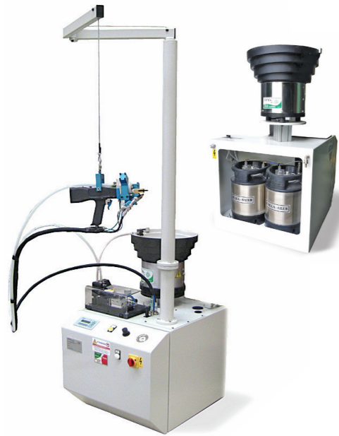
SPINAMATIC mod. GLF Pannello - Panel